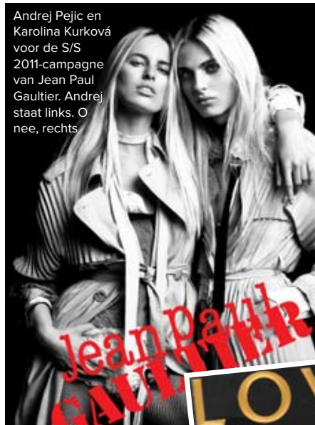
Andrej Pejic en Karolina Kurková voor de S/S 2011-campagne van Jean Paul Gaultier. Andrej staat links. O nee, rechts