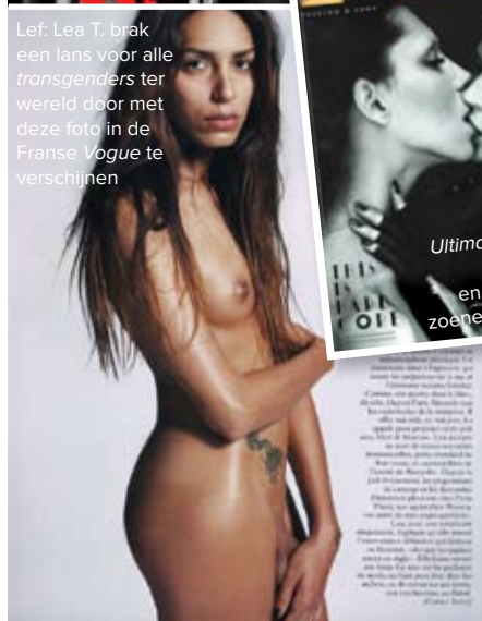
Lef: Lea T. brak een lans voor alle transgenders ter wereld door met deze foto in de Franse Vogue te verschijnen