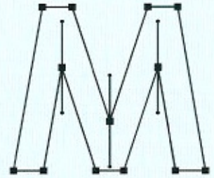
illustratie Robin Duister